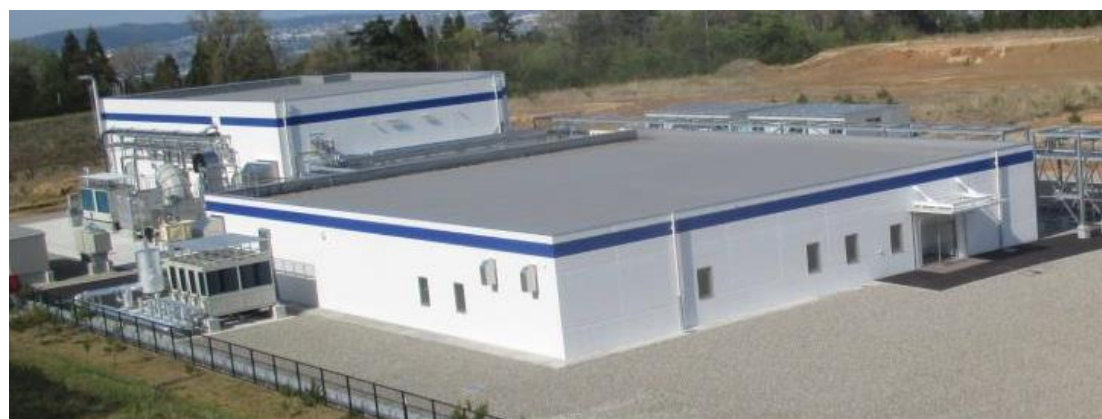
工場側面（手前：研究・品質管理棟、奥：少量合成棟）